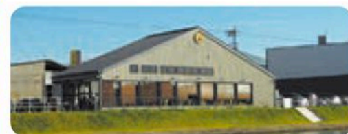
珈琲元年中川本店