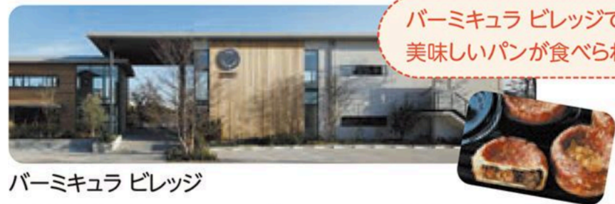
パーミキュラ ブレッジ