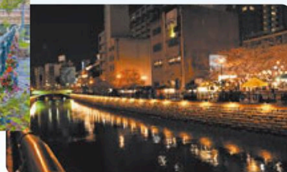
錦橋～天王崎橋のライトアップ