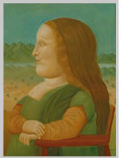
フェルナンド・ポテロ 《モナリザの横顔》 2020年 油彩/カンヴァス

開館時間 午前9:30～午後5:00 終了しています (9/23を除く金曜日は午後6:00まで。入館はいずれも閉館時間の30分前まで) 休館日 月曜日(祝休日の場合は翌平日)、ただし8/15(月)は開館 問合せ ☎212-0001 FAX212-0005