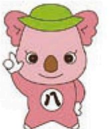
コアラの ハッピー

●消費生活相談(電話・面談) ☎222-9671 日時 祝休日を除く月曜～土曜日、午前9:00～午後4:15 (土曜日は電話のみ) ●くらしの情報プラザ 開館時間 午前9:00～午後5:00 休館日 日曜日・祝休日 問合せ ☎222-9677 FAX222-9678