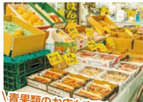
青果類のお店も充実!

高品質・高鮮度の食材からどんどん売れるので、お店を把握して効率的に買い物をしましょう。