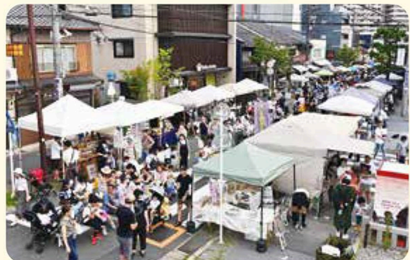
覚王山夏祭の様子(7月)

日泰寺の縁日(毎月21日)や季節ごとのお祭りなどイベント時は多くの人で賑わう。参道を中心に広がり、食べ歩きも楽しめる