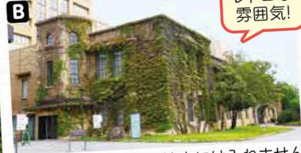
※いずれも敷地内には入れません