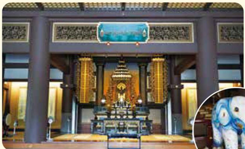
日タイ友好の象徴である象

シャム(現在のタイ)の国王から贈られたお釈迦様の御真骨(非公開)を安置(★奉安塔)。日本で唯一どの宗派にも属さない寺院